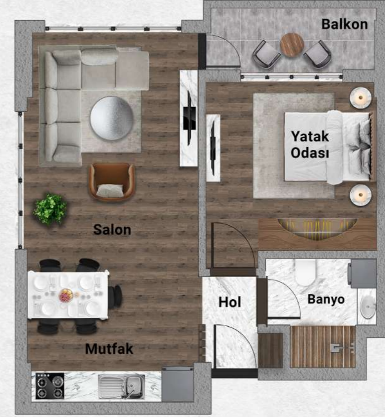
A Blok Tip 2 1+1