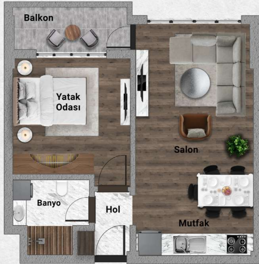
A Blok Tip 1 1+1