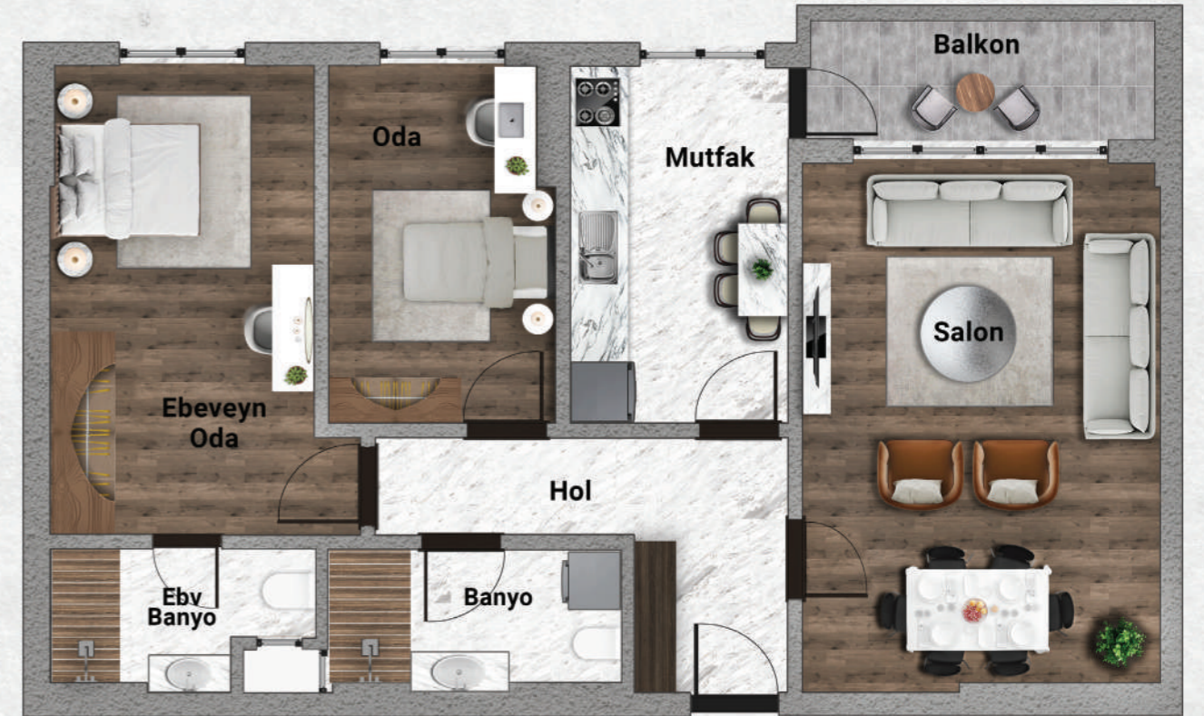
B Blok Tip 4 2+1