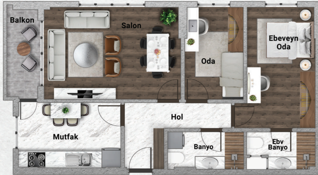
B Blok Tip 3 2+1