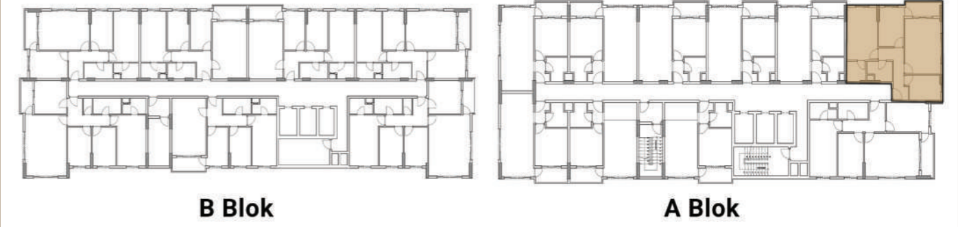
A Blok Tip 2 2+1